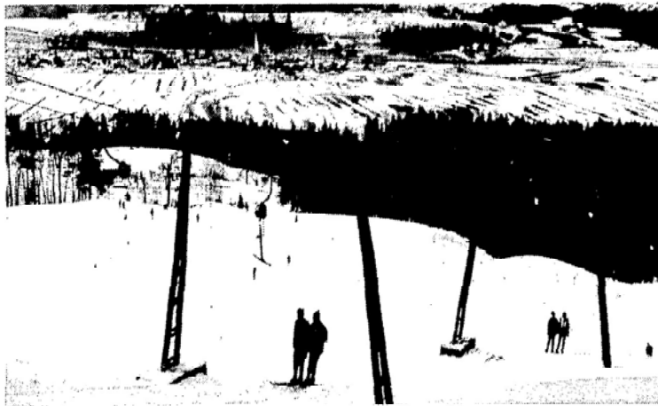
Skibetrieb am Sagberg.

Für den Betreiber ist es schon verwunderlich, daß bei der Vielzahl von im Außenbereich entstehenden Neubauten und ausgesprochenen Baugenehmigungen in diesem Fall, wo eine erhebliche Anzahl von Bürgern für den Weiterbetrieb plädiert, eine Genehmigung versagt wird.