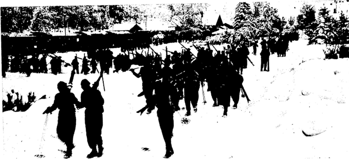
Großer Andrang zum Skigebiet Sagberg und Hochries herrschte schon in den 50er Jahren.